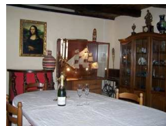
Salon - Salle à manger